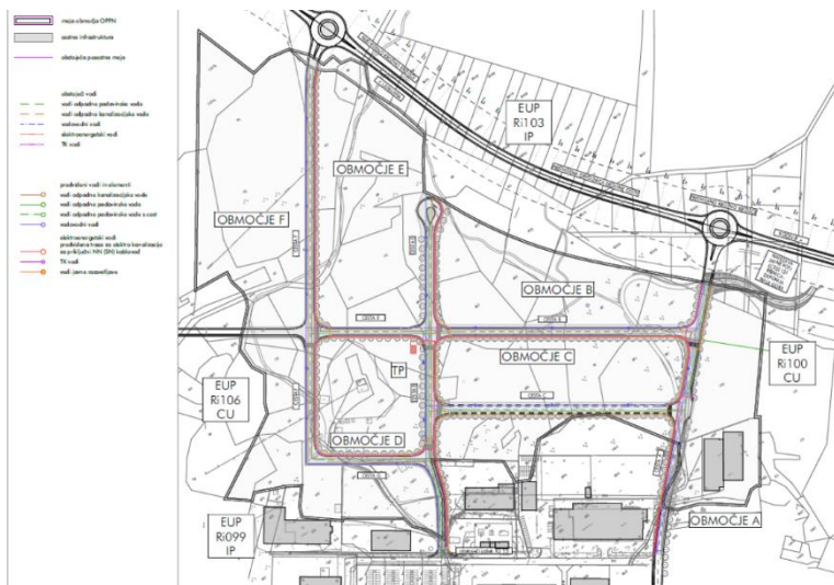
Prikaz ureditve priključevanja na gospodarsko javno infrastrukturo