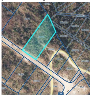
prikaz nepremičnine iz PISO